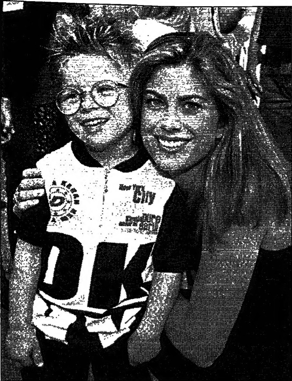
ظهرت كاتي ايرلند عارضة الازياء بصحبة النجم الطبق جوناثان ليونيك في الاحتفال بمرور 45 عاما على اطلاق غذاء الاطفال 'توتني' في لوس انجلوس امس الاول